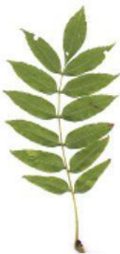
д) Ясень обыкновенный