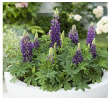
в) Люпин многолистный