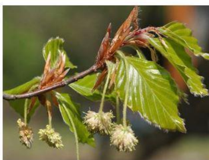
г) Бук лесной