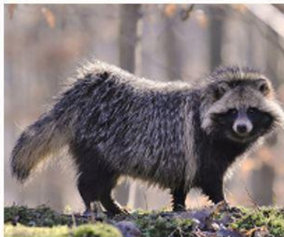
б) Собака енотовидная