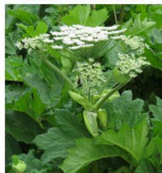
е) Борщевик Сосновского