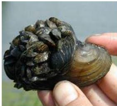
а) Речная дрейссена

Выберите виды-интродуценты, которые прежде не встречались на Европейской территории нашей страны.